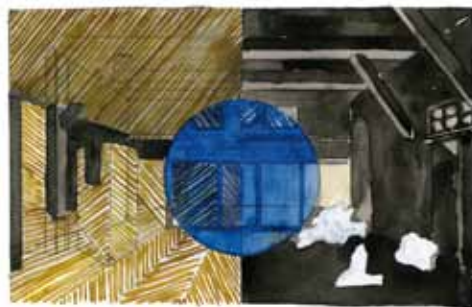
Reproductions d'aquarelles pour le projet « Bastia 3 et 4 » d'après le carnet de croquis de l'artiste (12,7 x 20,5 cm) sur papier Hahnemühle Fine art, Albrecht Dürer, 210 gsm, tirage jet d'encre pigmentaire.