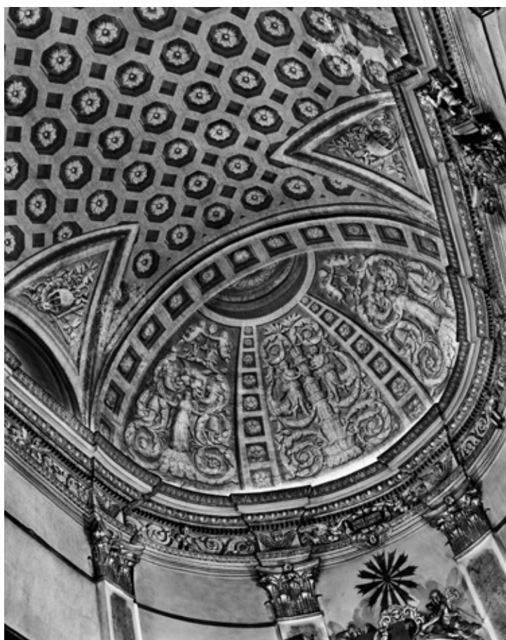
© Valérie Belin « Protocathédrale Sainte-Marie-de-l'Assomption, Bastia (citadelle) » Extrait de la série « le baroque en Corse », 2004 Collection Centre Méditerranéen de la Photographie n° inv. 176

Valérie Belin n'a pas cherché à souligner la qualité architecturale des différentes églises baroques corse où elle a réalisé les prises de vue, mais au contraire à en isoler les parties pour mettre en exergue le caractère bidimensionnel donné par la photographie. Elle a ainsi recréé de véritables trompe-l'œil avec une grande précision et une profondeur visuelle très marquée. Tout l'art du baroque étant centré avant tout sur l'aspect cliquant des choses... Le regard qu'elle a porté sur ces églises, renvoie également à la peinture grâce à l'écrasement des plans et au jeu des ornements, sublimés par le noir et blanc.