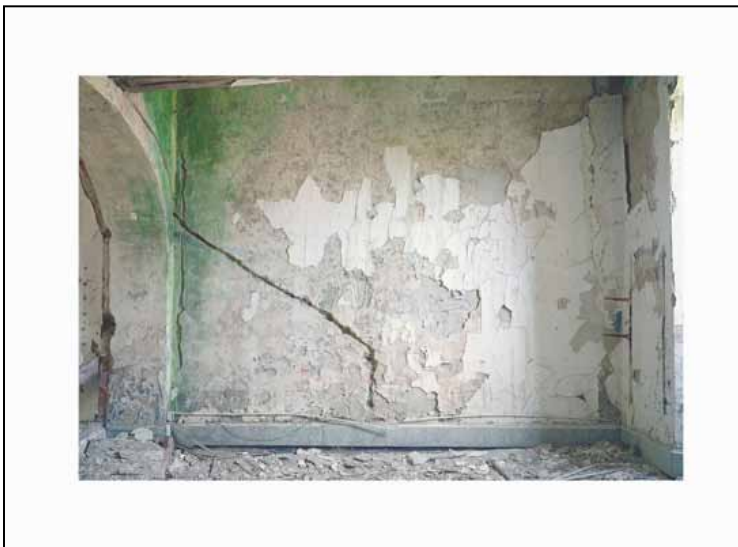
© André Mérian extrait de la série « Avant-travaux », 2007 Collection Centre Méditerranéen de la Photographie N°inv. 216

Sélection de 4 photographies couleur - tirages de type lambda marouflés sur aluminium - issues d'un ensemble de 12