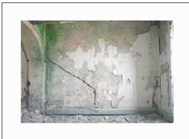
© André Mérian extrait de la série « Avant-travaux », 2007 Collection Centre Méditerranéen de la Photographie N°inv. 216