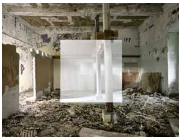
© Georges Rousse/adagp 2009 « Bastia 1 » extrait de la série « Palimpseste architectural », 2008 Collection Centre Méditerranéen de la Photographie, N°inv. 230