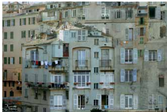
© Stéphane Couturier « Bastia, n°1 » Extrait de la série « Sédimentations urbaines », 2006 Collection du Centre Méditerranéen de la Photographie n° inv. 212