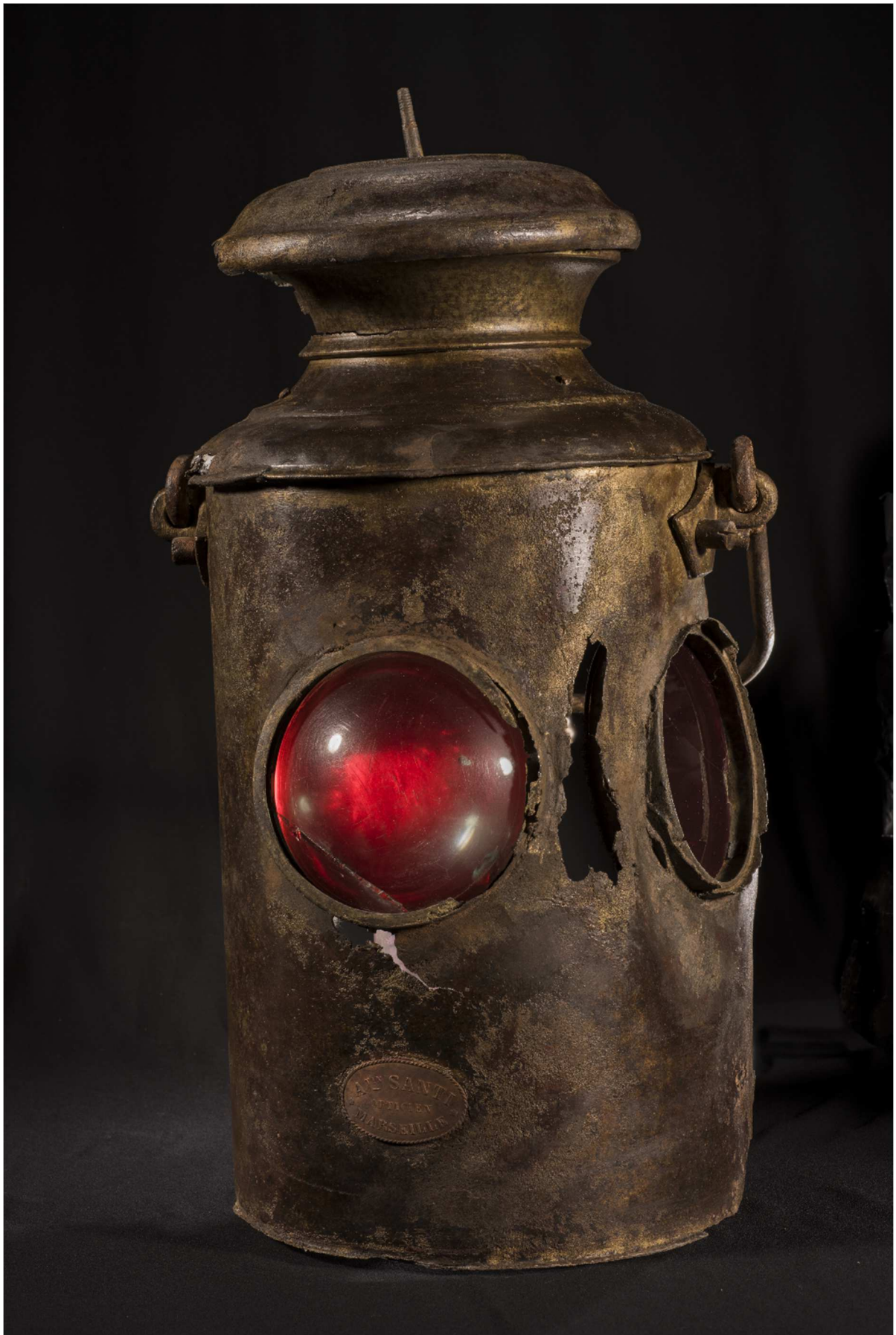
Lanterne, épave du Bonaparte , 1847, alliage cuivreux et verre, 47 x 25 cm, Drassm-MCC, n° inv. 4662.