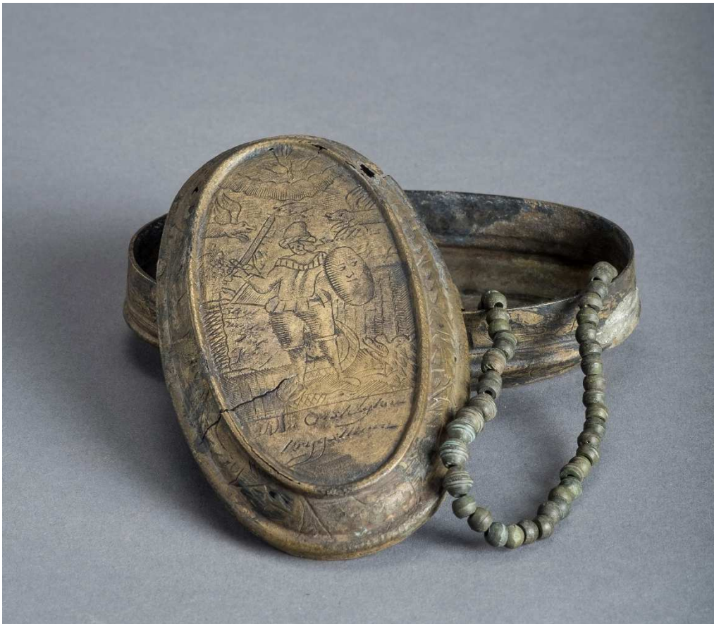
Boîte à tabac réemployée en boîte à chapelet, épave Port de l'Amirauté 1, supposée Vengeur , XVIII e siècle, alliage cuivreux et matériau organique, 12,5 x 6,9 x 3,3 cm, Drassm-MCC, n° inv. 27851, 27852 (cliché T. Seguin/Musée de Bastia).