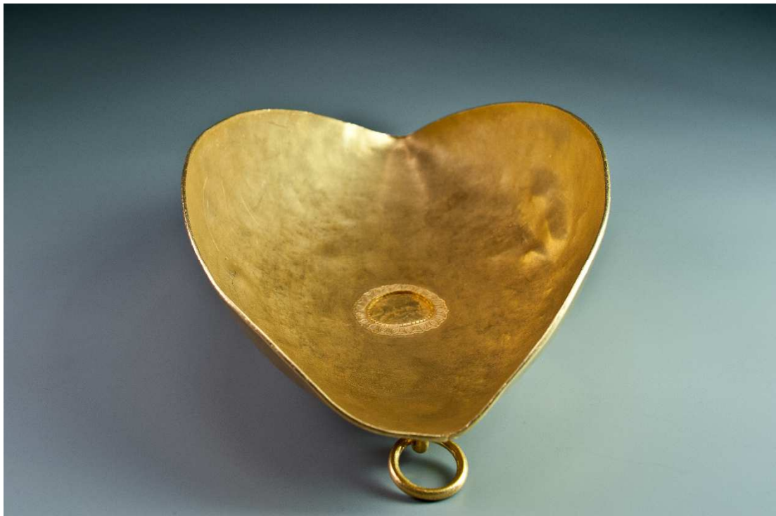
Plat en or avec anneau de suspension, Trésor de Lava, III e siècle ap. J.-C., or, 7,5 x 23,5 x 16 cm, 916 gr, saisie judiciaire, Drassm-MCC, n° inv. 29149.