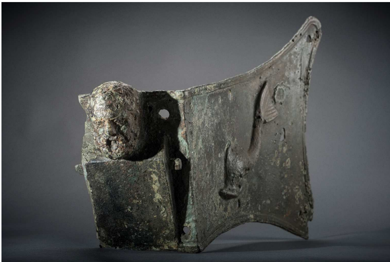
Plaque d'étrave, L'Île-Rousse, Antiquité, bronze, 38 x 51 x 13 cm, Drassm-MCC, n° inv. 3092, Dépôt Musée départemental de préhistoire et d'archéologie, Sartène.