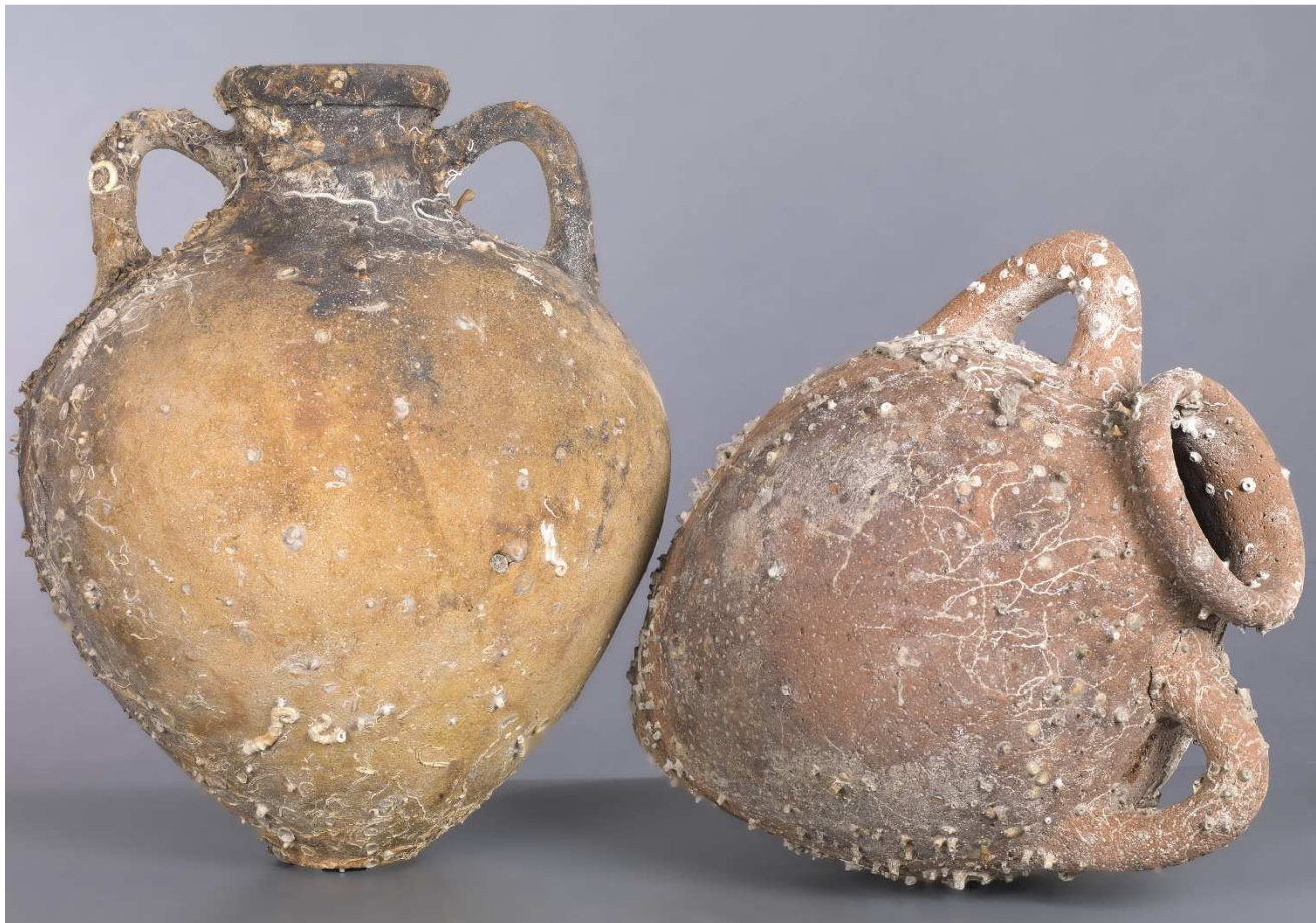
Amphores étrusques Py 3C simili, Cap Corse, IV e siècle av. J.-C., céramique, 47,5 x 36 cm, 54 x 44 cm, Drassm-MCC, n° inv. 29482 et n° inv. 29483.