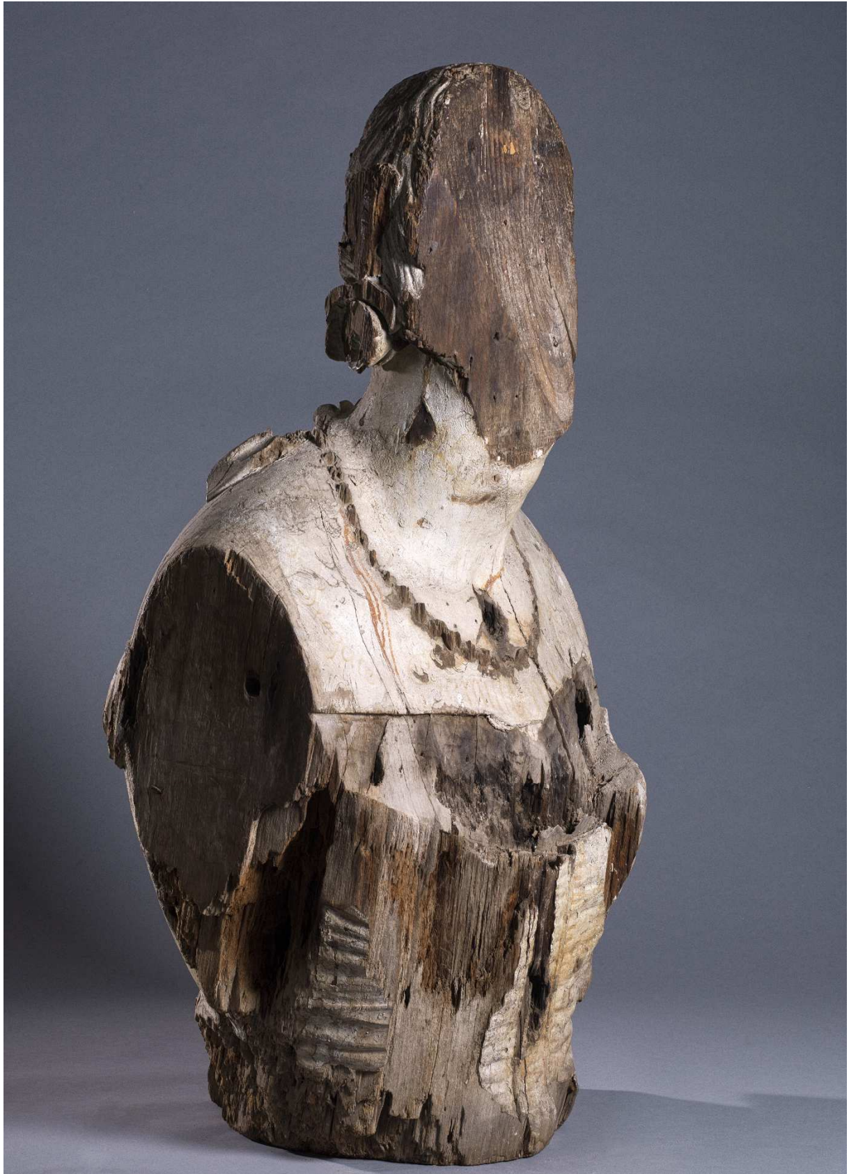
Figure de proue, épave de la Sémillante , 1855, Bois résineux, 133 x 90 x 55 cm, Drassm-MCC, n° inv. 28001.