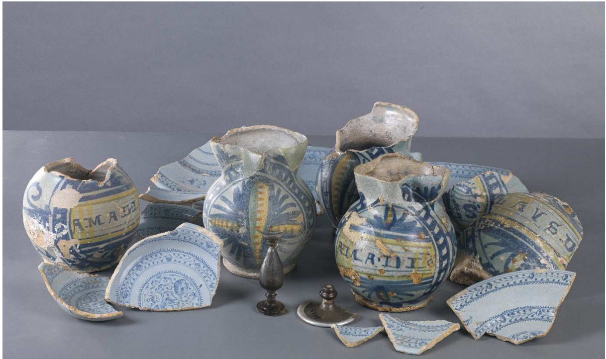
Pichets et fragments d'assiettes ligure, pieds de verre, épave Rocciu 1, XVI e siècle, faïence et verre, 15,5 cm, 15 cm, 13 cm, 16 cm, 10 cm, 16 cm, 10 cm x 3 cm, 10 cm, Drassm-MCC, n° 4106, 4329, 4331, 4332, 4334, 17668, 4555, 4357, 30759, 9267.