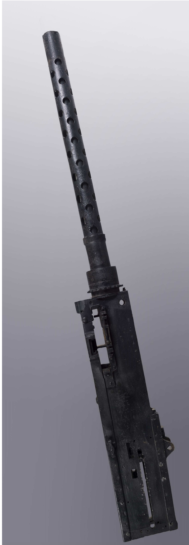
Mitrailleuse Browning calibre 50, Savage Arms Corporation, épave du bombardier B17 de Calvi, 1944, métal, 16 x 133 x 7 cm, Drassm-MCC, n° inv. 30855, (cliché J.-A. Bertozzi/Musée de Bastia).