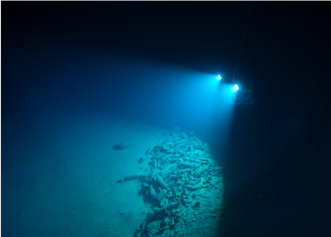
Fouilles de l'épave Aleria 1