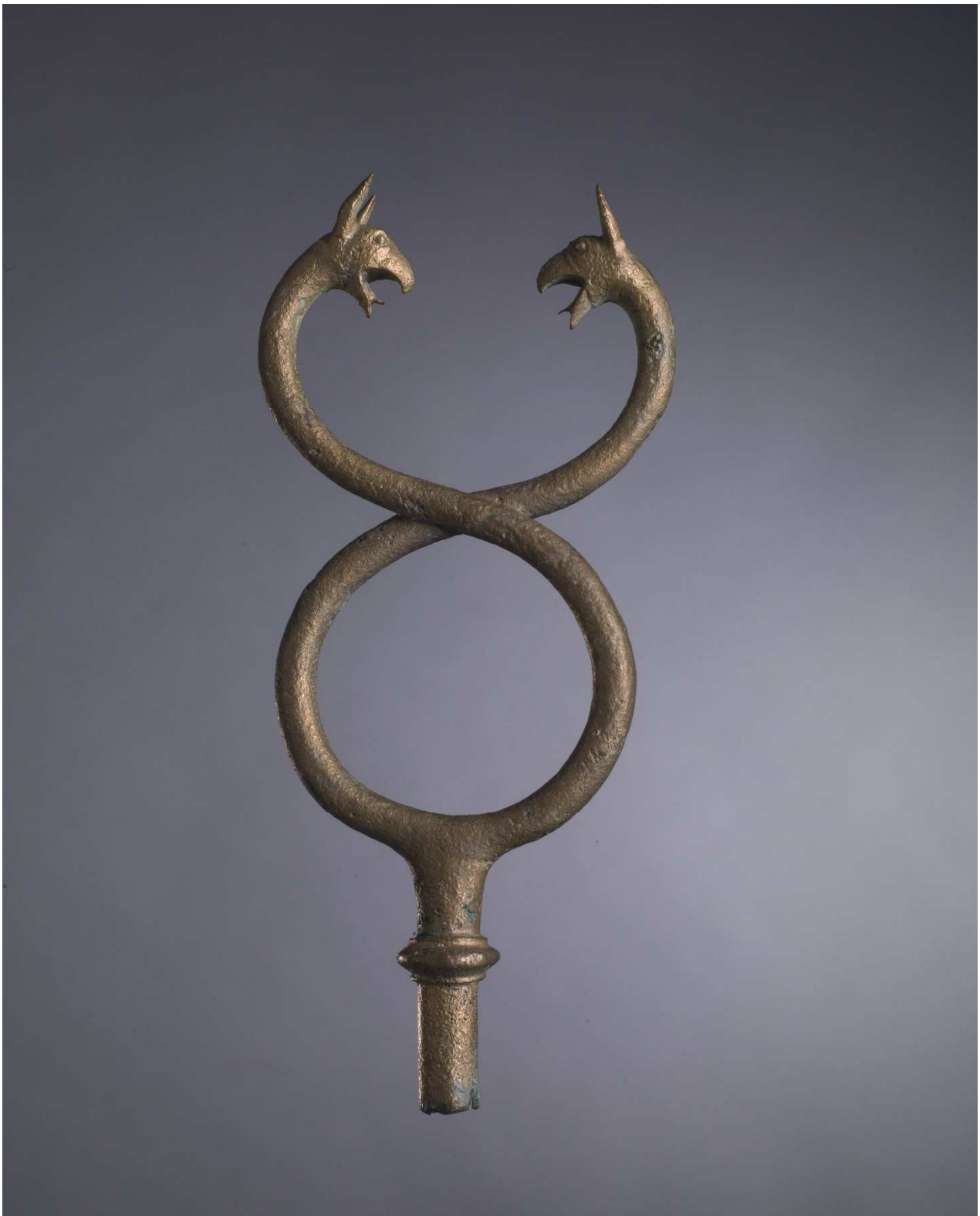
Caducée décoré de deux têtes de griffon affrontées, gisement Bugho 2, VI e -V e siècle av. J.-C., bronze, 18,5 x 8,5 x 2 cm, Drassm-MCC, n° inv. 12974.