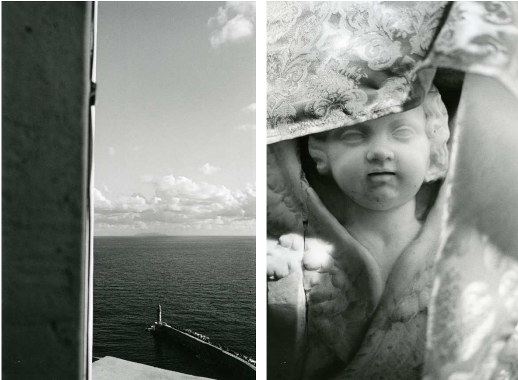
CAPRAIA, MER, CIEL ET JETÉE. 2008 / ANGE D'AUTEL. ORATOIRE STE-CROIX. 2009. TIRAGES ARGENTIQUES 40 X 60 CM

2 polyptyques N/B tirages numériques 75 x 100 cm