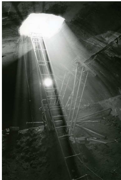
TOILE DE LA CRUCIFIXION. CATHÉDRALE STE-MARIE. 2009 / CITERNE À EAU. COUR DU MUSÉE DE BASTIA. 2009.