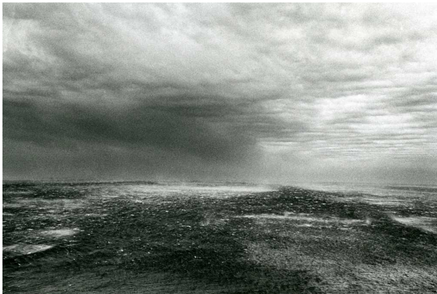
TEMPÊTE. 2009. TIRAGE ARGENTIQUE 60 X 40 CM