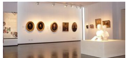
5 ans d'acquisitions