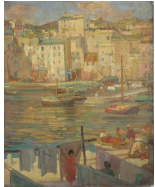
Un coin du Vieux port de Bastia - Léon Charles Canticcioni

A partir du 16 décembre 2010, les visiteurs du musée de Bastia sont invités à découvrir une sélection des nombreuses acquisitions réalisées par le musée au cours des cinq dernières années. Leur diversité et leur richesse sont évoquées à travers une cinquantaine d'objets : peintures, sculptures, arts graphiques, objets publicitaires ... Des panneaux didactiques retracent les principales étapes de cet enrichissement, de la définition d'une politique d'acquisition à la mise en valeur des œuvres, en passant par le chantier des collections, les procédures à suivre, la conservation préventive et la restauration.